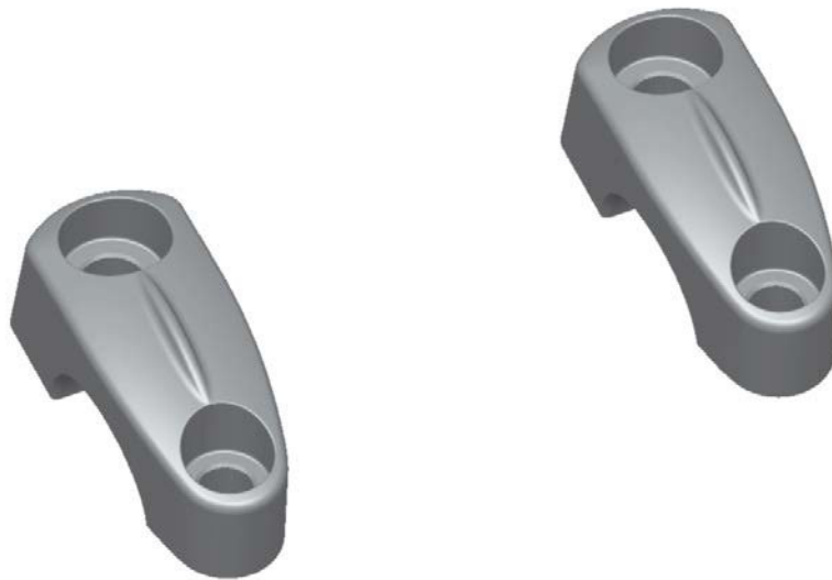
Lenkerhalter, Ausführung AZ452