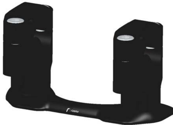
Lenkerhalter, Ausführung AZ202