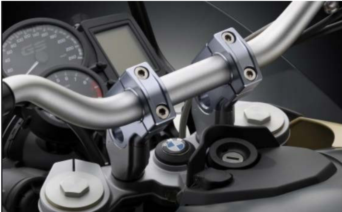
Lenkerhalter, Ausführung AZ450