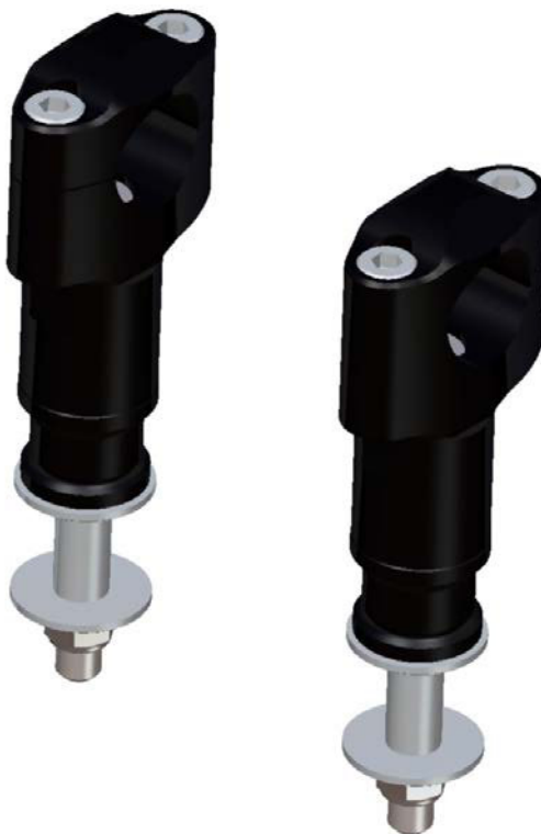
Lenkerhalter, Ausführung AZ803