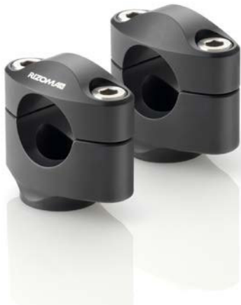
Lenkerhalter, Ausführung AZ432