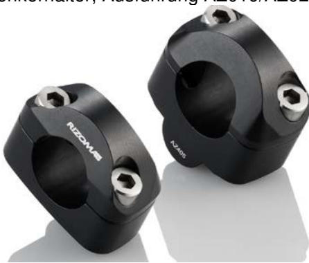
Lenkerhalter, Ausführung AZ405