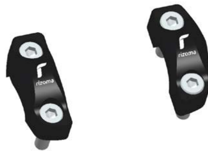
Lenkerhalter, Ausführung AZ501