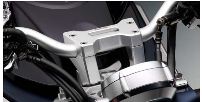
Lenkerhalter, Ausführung AZ110