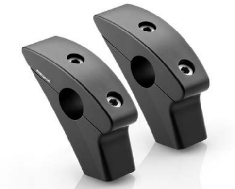
Lenkerhalter, Ausführung AZ019/AZ020