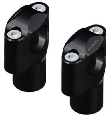
Lenkerhalter, Ausführung AZ403