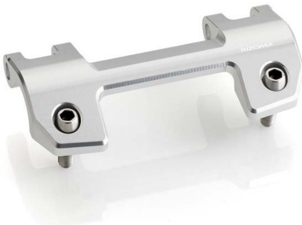
Lenkerhalter, Ausführung AZ310