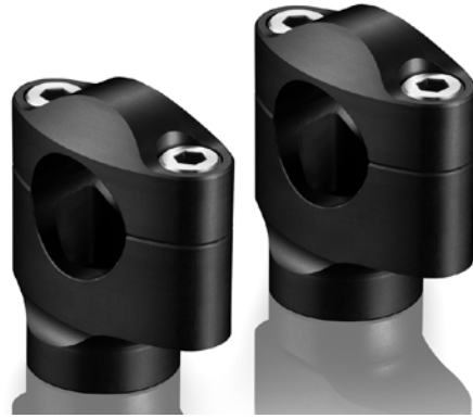
Lenkerhalter, Ausführung AZ402