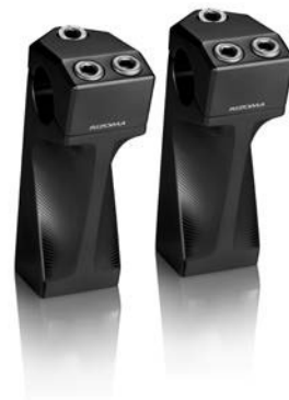
Lenkerhalter, Ausführung AZ014/AZ016/AZ018