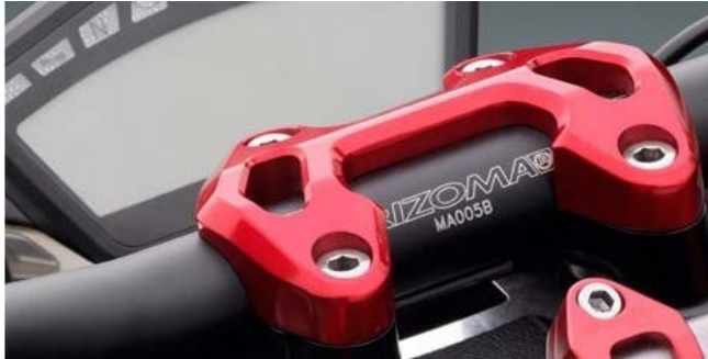
Lenkerhalter, Ausführung AZ200