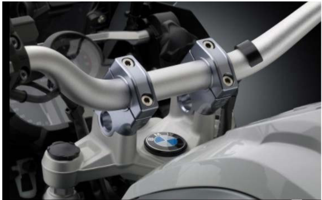
Lenkerhalter, Ausführung AZ451