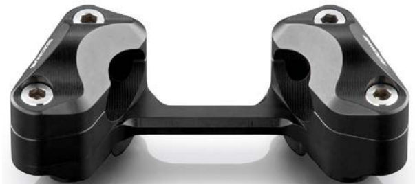
Lenkerhalter, Ausführung AZ600