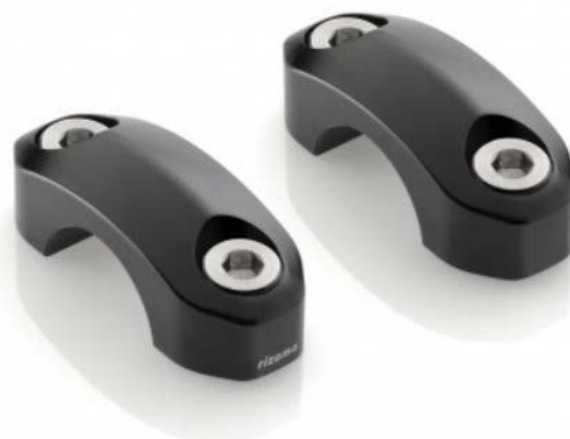
Lenkerhalter, Ausführung AZ701