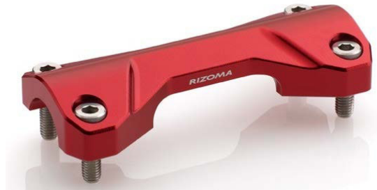
Lenkerhalter, Ausführung AZ201