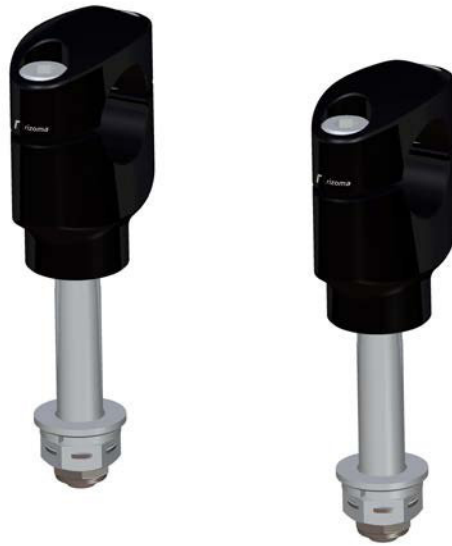
Lenkerhalter, Ausführung AZ430