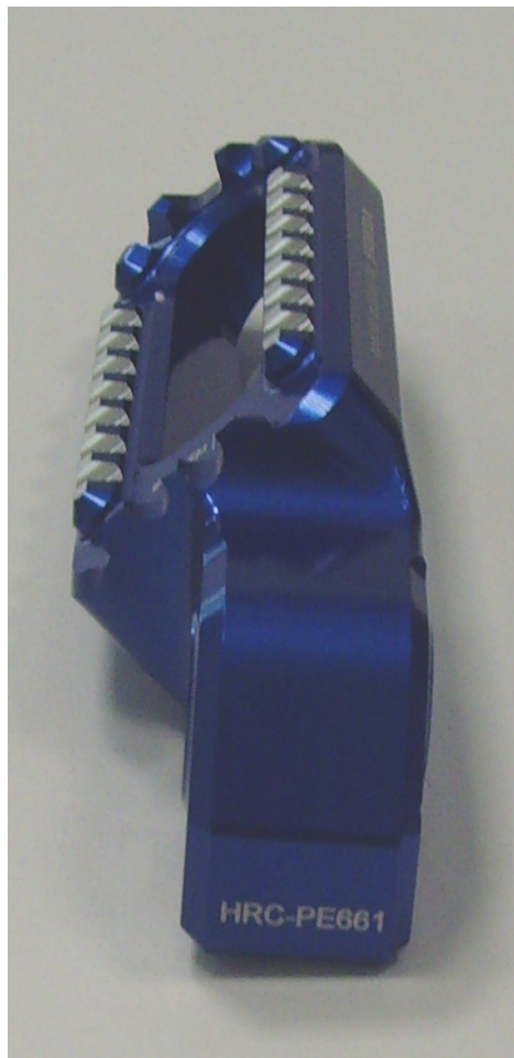
Austauschraste, Ausführung HRC PE661