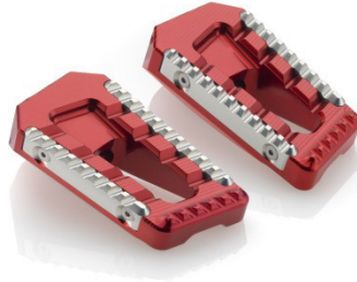
Austauschraste, Ausführung PE622