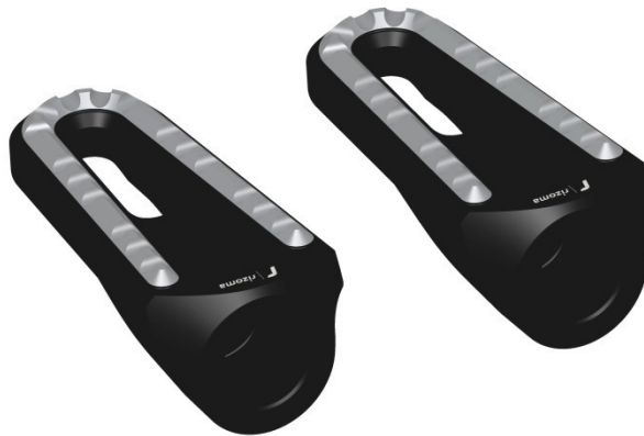
Austauschraste, Ausführung PE642