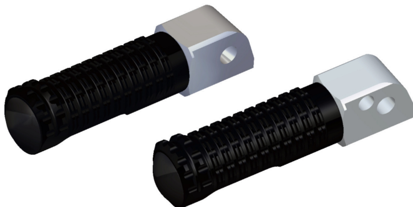
Austauschraste, Ausführung PE127